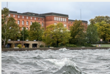
Die Oktoberflut schlug hohe Wellen – auch vor dem Landeshaus

10 Sturmflut: Außerordentliche Sitzung des Landtages