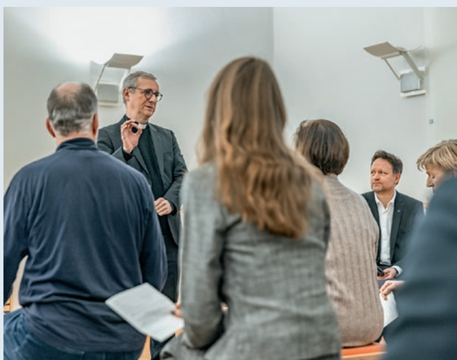
Der katholische Erzbischof von Hamburg, Stefan Heße, hielt Mitte Dezember die ökumenische Morgenandacht im Raum der Stille. Dorthin laden die beiden großen christlichen Kirchen Gläubige aller Religionen zum Auftakt jeder Plenarsitzung. Der Erzbischof war zum Antrittsbesuch bei Landtagspräsidentin Kristina Herbst nach Kiel gekommen.