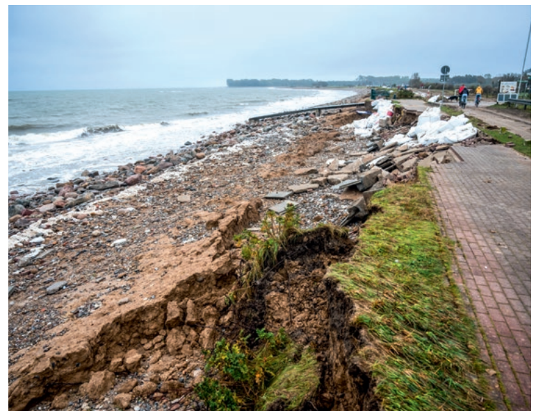
Die Folgen der Flut: beschädigte Boote in Damp, unterspülter Deich bei Maasholm