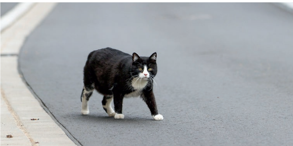
Laut Schätzungen sind zehntausende streunende Katzen in Schleswig-Holstein unterwegs.