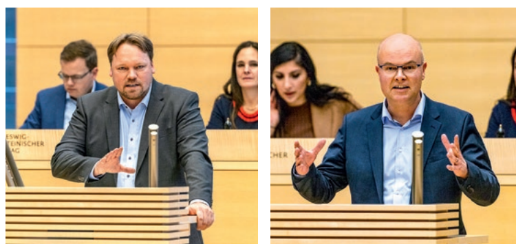
Kontroverse zum Zustand der Deiche: Oliver Kumbartzky (FDP, li.), Umweltminister Tobias Goldschmidt (Grüne)

Er habe ein „Screening aller Regionaldeiche veranlasst“, entgegnete der Minister. Im ersten Quartal 2024 werde mit den Verantwortlichen vor Ort darüber gesprochen, wo Regionaldeiche zu Landesschutzdeichen umgewidmet werden können. Man werde prüfen, „an welchen Stellen wir mit harten, starken Küstenschutzmaßnahmen reingehen, und an welchen Stellen wir der Ostsee Raum geben“. Wegen der Klimakrise werde der Küstenschutz künftig deutlich teurer werden, mahnte Goldschmidt.