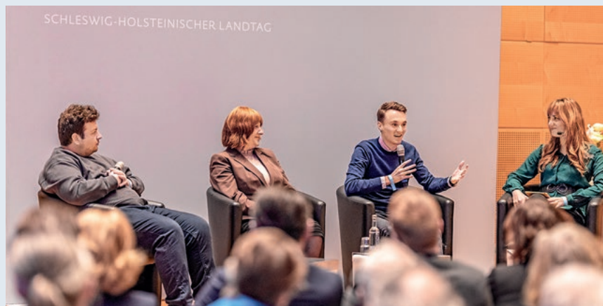
Am 9. November, dem 85. Jahrestag der antijüdischen Pogrome von 1938, zeigte der Landtag den Film „Masel Tov Cocktail“ über einen jüdischen Jugendlichen im heutigen Deutschland. Anschließend diskutierte Regisseur Arkadij Khaet (li.) mit Mitgliedern der jüdischen Gemeinden in Schleswig-Holstein.