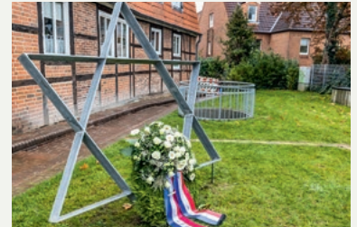
Am Denkmal für die zerstörte Synagoge in Bad Segeberg legte Landtagspräsidentin Kristina Herbst am 9. November einen Kranz nieder.

18 Jüdisches Leben: Runder Tisch „Shalom & Moin“, Gesetz gegen Diskriminierung, Bildungsoffensive gegen Antisemitismus, Gedenken an November-Pogrome 1938