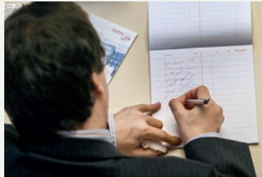
Der Stenografische Dienst des Landtages notiert jedes Wort – und gelegentlich auch Bonmots.

12 Im Zentrum: Blick ins Protokoll – die Zitate des Jahres 2023