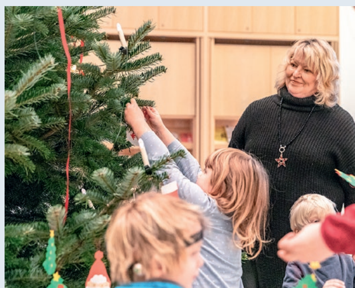
Kinder der dänischen Kita Børnehave aus Kiel-Pries haben Anfang Dezember gemeinsam mit Landtagsvizepräsidentin Jette Waldinger-Thiering den traditionellen Weihnachtsbaum in der Eingangshalle des Landtags geschmückt.