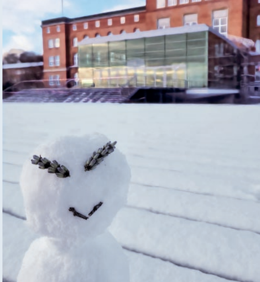
Zum Winter- einbruch Ende November erschien ein Schneemann vor dem Plenarsaal des Landtages.